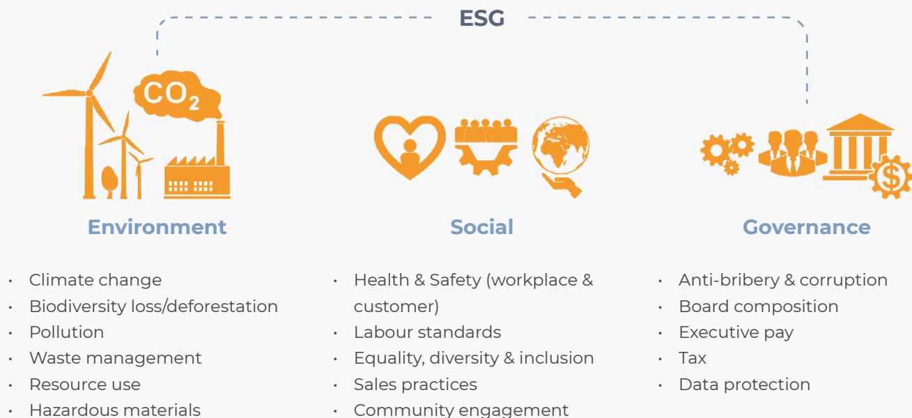
Figuur 1. Environmental, Social & Governance